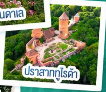
ปราสาทกูไรต้า