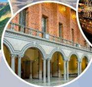
เข้าชมศาลาว่าการ กรุงสต็อกโฮล์ม