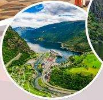
นั่งรถไฟสายโรแมนติก "Flamsbana"