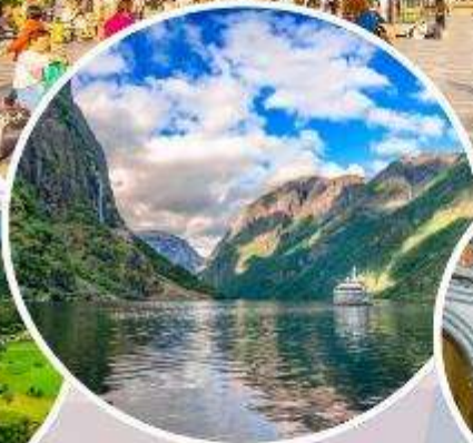
ล่องเรือ "Naerøyfjord"