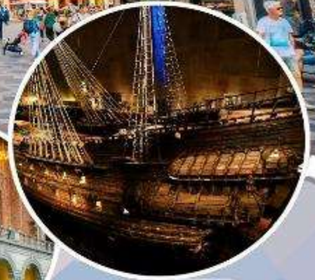
เข้าชม "พิพิธภัณฑ์เรือวาซา"