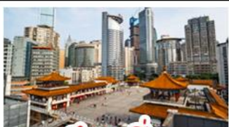
ตึกขุยซิง

พระแกะสลักหินต้าจู้ - หลุมฟ้าสะพานสวรรค์ - เขานางฟ้า ตึกขุยซิง - ตึกตะเกียบ หมู่บ้านโบราณฉือซีไห่