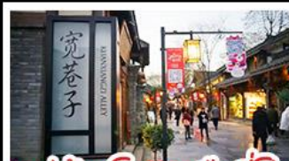
หมู่บ้านโบราณฉือซีไห่