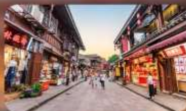
หมู่บ้านโบราณฉีโง่ว