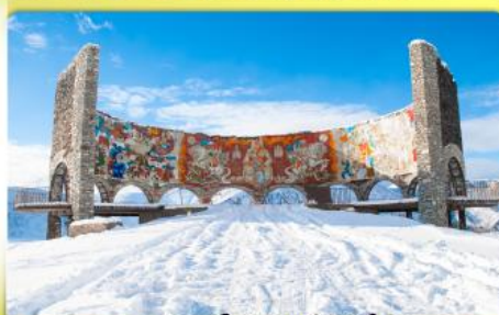
อนุสรณ์สถานรัสเซีย