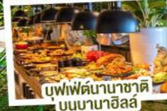
บุฟเฟ่ต์นานาชาติบนบานาฮิลล์