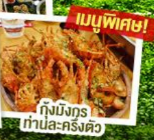
กึ่งมังกรท่านละครึ่งตัว