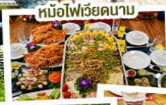
หม้อไฟเวียดนาม