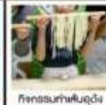
กิจกรรมทำเส้นอุด้ง