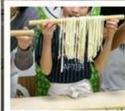
กิจกรรมทำเส้นอุด้ง