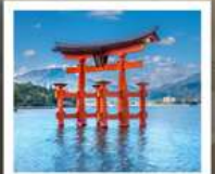
ศาลเจ้าอิตสึคุชิมะ