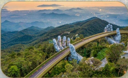
สะพานมือทองคำ