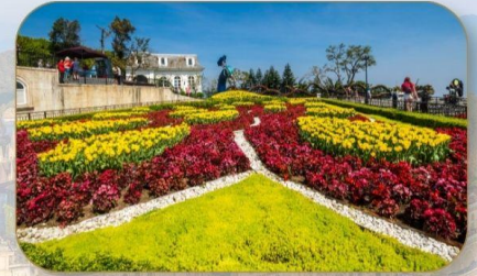
สวนดอกไม้ Le Jardin D'Amour