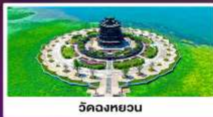
วัดจงหยวน