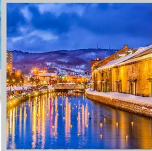
"OTARU CANAL FEST"