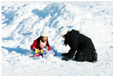
Playing in the snow