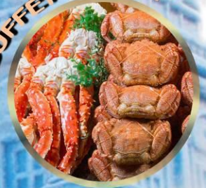
SAPPORO SNOW FESTIVAL 2027