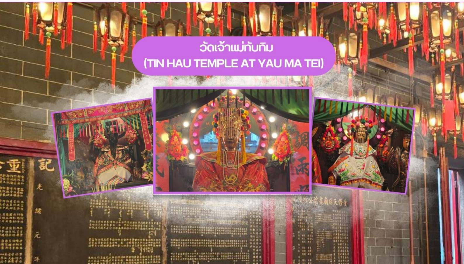
วัดเจ้าแม่ทับทิม (TIN HAU TEMPLE AT YAU MA TEI)

นำท่านเดินทางสู่ วัดเจ้าแม่ทับทิม (Tin Hau Temple at Yau Ma Tei) ที่ Yau Ma Tei Station ถือเป็น วัดเจ้าแม่ทับทิมแห่งนี้ถือเป็นวัดเก่าแก่และมีความสำคัญแห่งหนึ่งของฮ่องกง สังเกตได้ว่าพื้นที่ของประเทศจีนซึ่งมีดินแดนติดทะเลจะมีการบูชาองค์เจ้าแม่ทับทิม ซึ่งเชื่อกันว่าท่านจะช่วยคุ้มครองให้รอดพ้นภัยพิบัติทางทะเล ช่วยให้การเดินทางราบรื่น ปัดเป่าความชั่วร้าย เดินทางปลอดภัย