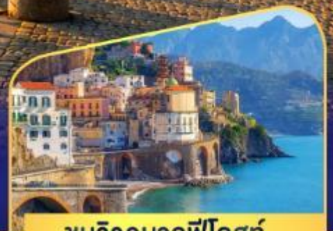
ชมวิวมอลฟีโคสก์