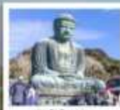
วัดโทคุชิน