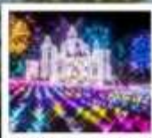
งานประดับไฟสวนอาชิคาเงะ