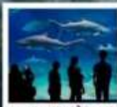
พิพิธภัณฑ์สัตว์น้ำโอเอะไร