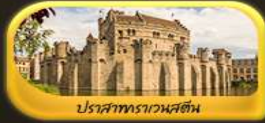
ปราสาทราเวนสตีล