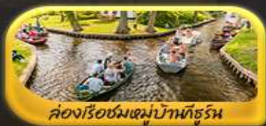
คลองเรือชมหมู่บ้านกังหัน