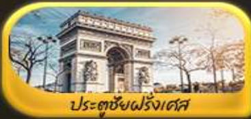
ประตูชัยฝรั่งเศส