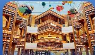
ห้องสมุดดสตาร์ฟิค