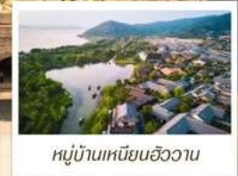
หมู่บ้านเหมียนฮิววาน

🧳 โหลด 23 KG. x1 ทั้งไป - กลับ ✓ พรีเมียมทิวส์ ✓ ไม่เข้าร้านรัฐบาล ✓ ทิวส์กรุ๊ปเล็ก ✓ รวมค่าเข้าชมสถานที่ตามโปรแกรม