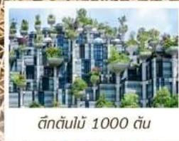
ตึกต้นไม้ 1000 ต้น