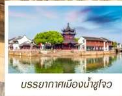
บรรยากาศเมืองน้ำซูโจว