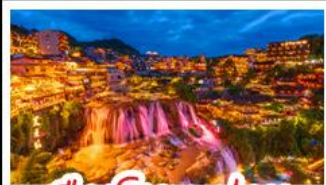
เมืองโบราณฟูหลง

เมืองโบราณฟิ่งหวง - เมืองโบราณฟูหลง หงหยาดัง - ประตูลั่วจื่อ - รถไฟทะลุคด