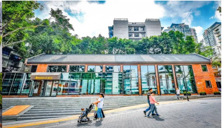
กลางวัน รับประทานอาหารกลางวัน ณ ภัตตาคาร (มือที่ 11)

นำท่านเดินทางสู่ ถนนคนเดินเอ๋อหลิง จากโรงงานพิมพ์ธนบัตร สู่แลนด์มาร์กศิลปะสุดฮิปแห่งฉงชิ่ง ท่ามกลางภูเขา ถนนลาดชัน และตึกสูงอันเป็นเอกลักษณ์ของมหานครฉงชิ่ง มีสถานที่แห่งหนึ่งที่สะท้อนเสน่ห์ของ “เมืองเก่าและเมืองใหม่” ได้อย่างสมบูรณ์แบบ นั่นคือ “TESTBED2” แลนด์มาร์กสายอาร์ตที่กำลังกลายเป็นหัวใจของวัฒนธรรมสร้างสรรค์ในเมืองฉงชิ่ง เดิมทีสถานที่แห่งนี้คือ “โรงพิมพ์ธนบัตรกลาง” ที่ก่อตั้งขึ้นในปี 1937 ในยุคสาธารณรัฐจีน ก่อนจะเปลี่ยนชื่อเป็น โรงพิมพ์หมายเลข 2 ของฉงชิ่งในปี 1953 ซึ่งเคยเป็นศูนย์กลางงานพิมพ์ที่สำคัญที่สุดแห่งหนึ่งของจีนตะวันตกเฉียงใต้ ทั้งธนบัตร แสตมป์ ตั๋ว และเอกสารราชการจำนวนมาก ล้วนเคยถูกผลิตจากที่นี่