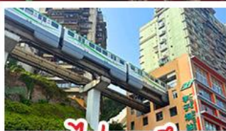
รถไฟทะลุคด