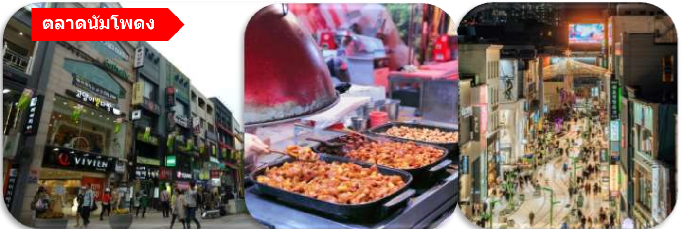
ตลาดนัมโพดง

เดินทางต่อไปยัง ตลาดนัมโพดง (Nampo-dong Market) แหล่งช้อปปิ้งชื่อดังใจกลางเมืองปูซาน เต็มไปด้วยร้านค้าแฟชั่น ของฝาก สตรีทฟู้ด และบรรยากาศคึกคักตลอดทั้งวันนักท่องเที่ยวสามารถเดินเล่นชิมอาหารท้องถิ่น และสัมผัสวิถีชีวิตเมืองเก่าที่ผสมผสานความทันสมัยได้อย่างลงตัว