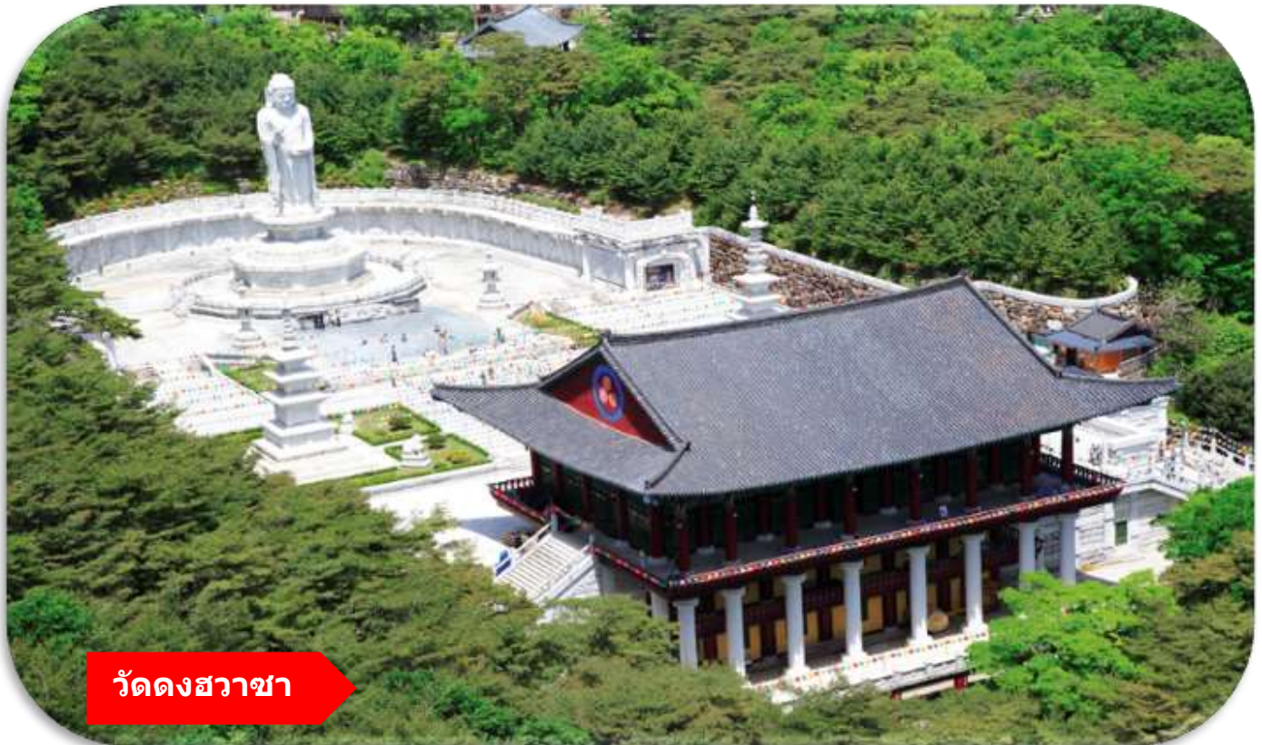
วัดดงฮวาซา

จากนั้น นำท่านเที่ยวชม วัดดงฮวาซา (Donghwas Temple) (รวมกระเช้า พัลกงชานเคเบิลคาร์) เป็นวัดพุทธนิกายโชกเยเก่าแก่กว่า 1,500 ปี ตั้งอยู่บนภูเขาพัลกงชานในเมืองแทกู โดดเด่นด้วยทัศนียภาพธรรมชาติที่สวยงาม ไฮไลท์สำคัญคือ "พระพุทธรูปหินขนาดใหญ่" หรือ พระพุทธรูปหินขนาดใหญ่ยักษ์สูงมากกว่า 30 เมตร สถาปัตยกรรมโบราณและกิจกรรมการพักผ่อนเชิงปฏิบัติธรรม สายมูห้ามพลาด ซึ่งคนเกาหลีนิยมไปสักการะเพื่อขอพรเรื่อง สุขภาพ อายุยืน แคล้วคลาดปลอดภัย ผ่านอุปสรรคต่าง ๆ