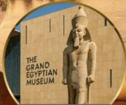
พิพิธภัณฑ์แกรนด์อียิปต์