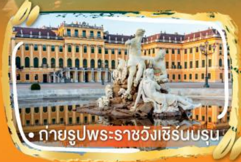
• ถ่ายรูปพระราชวังเซรินบรุน