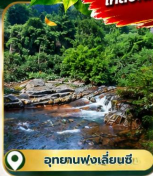
อุทยานฟงเลี่ยนซี