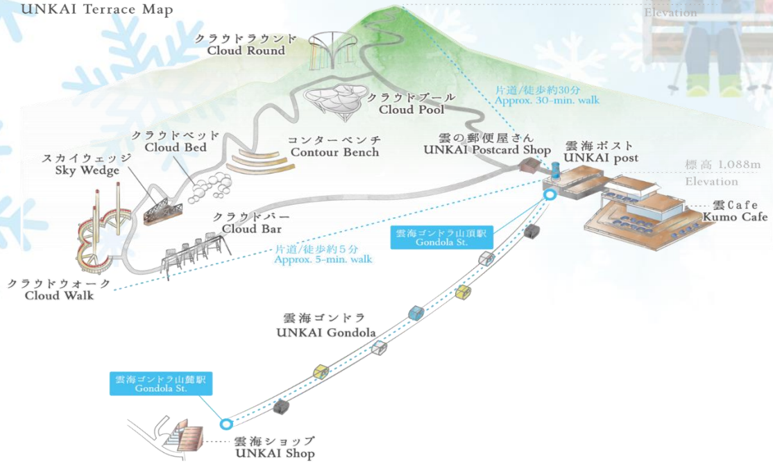
雲海テラスマップ UNKAI Terrace Map

เดินทางสู่ เมืองอาซาฮิคาว่า เป็นเมืองที่ใหญ่เป็นอันดับสองของเกาะฮอกไกโด รองจากนครซัปโปโระมีร้านค้าที่ขายข้าวและผักที่ปลูกได้ในเมือง และยังมีร้านอาหารทะเลตั้งอยู่มากมาย การคมนาคมสมบูรณ์แบบ ทำให้แต่ละปีมีผู้มาท่องเที่ยวกว่า 5 ล้านคนจากทั้งในและต่างประเทศ