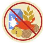
● แพ้อาหาร / อื่นๆโปรดระบุ