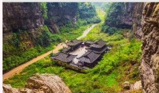
อุทยานหลุมฟ้าสะพานสวรรค์