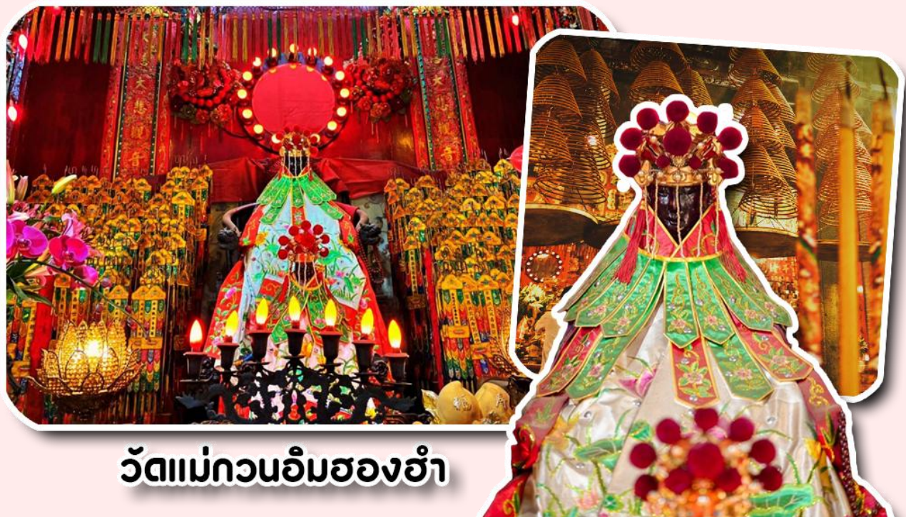
วัดแม่กวนอิมฮองฮำ

พาท่านเดินทางไปไหว้ขอพรขอเงิน วัดแม่กวนอิมฮ่องกง วัดเก่าแก่ของฮ่องกงสร้างตั้งแต่ปี ค.ศ. 1873 เป็นวัดขนาดเล็กที่มีชาวฮ่องกงศรัทธานับถือกันเป็นอย่างมาก วัดแห่งนี้เป็นที่ประดิษฐาน องค์เจ้าแม่กวนอิมฮ่องกง ที่มีชื่อเสียงเรื่องการให้กู้ยืมเงิน เชื่อกันว่าท่านช่วยพลิกฟื้นเศรษฐกิจของชาวฮ่องกง ผู้คนจึงนิยมมายืมเงินทำธุรกิจจนสำเร็จร่ำรวย รุ่งเรือง โดยให้ท่านอธิษฐานขอพรต่อหน้าเจ้าแม่กวนอิมของฮำ พร้อมกับระบุวันเวลาในการขอพรด้วย จากนั้นนำธนบัตรตามฐานะและศรัทธาที่เราจะนำเป็นสื่อในการขอพร เขียนจำนวนเงินที่ต้องการลงไปด้วย ใส่สกุลเงินยี่งดีใหญ่ แล้วนำเงินใส่ในซองแดง ควรเตรียมซองแดงไปเอง นำซองแดงไปวนรอบกระถางธูป วนขวาจำนวน 3 ครั้ง แล้วเก็บซองแดงในกระเป๋าสตางค์ เป็นเงินขวัญถุง ถ้าประสบความสำเร็จตามที่มุ่งหวัง ให้นำเงินในซองแดงทำบุญหยอดตู้ที่วัดแห่งนี้ในโอกาสต่อไป วิธีไหว้ให้ปัง ให้ได้โชคลาภเงินทอง ต้องไปกับเราเท่านั้น