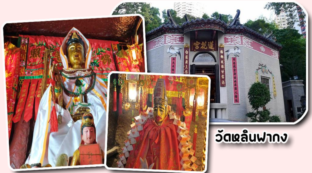
วัดหลินฟาง

พาท่านเดินทางไป วัดหลินฟ้า หรือ วัดดอกบัว เป็นวัดที่อยู่บริเวณหว่านจ่าย ทางทิศตะวันออกเฉียงเหนือของคอสเวย์เบย์ โดยวัดนี้จะถูกก่อสร้างในช่วงราชวงศ์ชิงหรือ ปี ค.ศ. 1963 มีการบูรณะอีกครั้งในปี ค.ศ 1986 และ 1999 มีเจ้าแม่กวณอิบเป็นองค์ประธานของวัด โดยมีตำนานเล่าว่า เจ้าแม่กวณอิบเคยมาปรากฏตัวที่วัดแห่งนี้ ชาวบ้านจึงเลื่อมใสศรัทธา จนรวมใจกันสร้างวิหารดอกบัวและประดับด้วยโคมดอกบัวต่างๆ เพื่อเป็นการบูชาและสักการะ นอกจากนี้ทางวัดหลินฟ้าก็ยังมี เทพเจ้าฮ่าวจื่อเฮียะ หรือเทพเจ้าสายนรก เป็นเทพเจ้าที่ขึ้นชื่อเรื่องกตัญญูที่มาในรูปลักษณะการนุ่งห่ม ผ้าดิบ ซึ่งเป็นสัญลักษณ์ของการไว้ทุกข์ที่คนเชื้อสายจีนให้ความสำคัญ เทพเจ้าองค์นี้ ก็เปี่ยมไปด้วยพลังหยิน ซึ่งเป็นด้านเกี่ยวกับเงินเงินทองทอง สำหรับผู้ที่ชอบเสี่ยงโชค