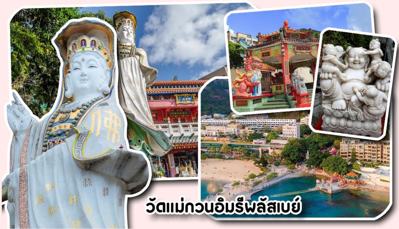
วัดแม่กวณอิบรีพลัสบย

อยากได้ลูกสาวให้ลู่บ่ท้องขวา ถัดมาคือ เจ้าแม่ทับทิมเทพีแห่งท้องทะเล ท่านจะคอยคุ้มครองผู้เดินทางทางเรือ หรือผู้ที่เดินทางไปไหนมาไหนท่านจะคอยคุ้มครองให้ปลอดภัย และมีโชคลาภ ถัดจากบริเวณที่กราบไหว้ขอพร ก็จะมีศาลาแปดเหลี่ยมริมน้ำ และสะพานเล็กๆ ที่ชื่อว่าสะพานต่ออายุ ซึ่งเชื่อกันว่าหากเดินข้ามสะพานแห่งนี้ 1 ครั้ง ก็จะมีอายุยืนขึ้น 3 ปี