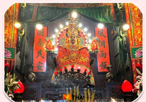
นางฟ้าพามู

จากนั้นเดินทางไปที่ วัดทินหัว (วัดเจ้าแม่ทับทิม) เป็นวัดเก่าแกในฮ่องกง สมัยก่อนฮ่องกงเป็นหมู่บ้านชาวประมง ซึ่งคนจะให้ความเคารพนับถือเจ้าแม่ทับทิมทินหัวเป็นอย่างมาก เพราะเชื่อว่าเป็น เทพีแห่งท้อง