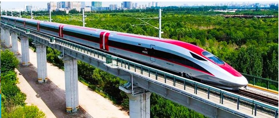
บริการรถไฟความเร็วสูง