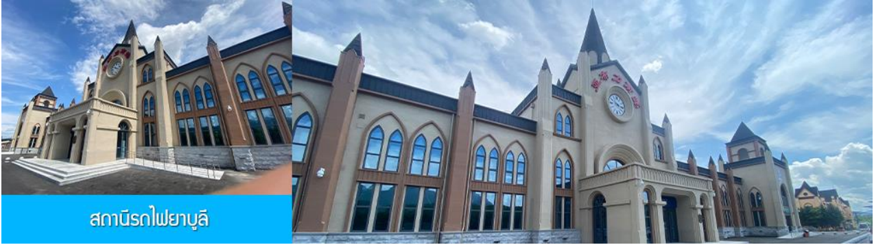
สถานีรถไฟยาบูลี

นำท่านเที่ยวชม สถานีรถไฟยาบูลี 亚布力南站 (ชมด้านนอก) ได้ชื่อว่าเป็นสถานีรถไฟที่สวยงามที่สุดของจีน โดดเด่นด้วยสถาปัตยกรรมแบบตะวันตก ให้ท่านเก็บภาพบรรยากาศความสวยงามของสถานีรถไฟที่ปัจจุบันยังคงเปิดให้บริการอยู่