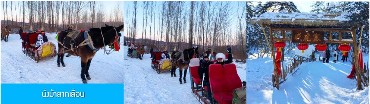
นั่งม้าลากเลื่อน