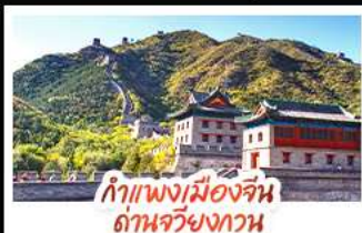
กำแพงเมืองจีน ด่านจวิ๊ยกกวน

ล่องเรือสุดโรแมนติกแม่น้ำหวงผู้ ปักกิ่ง...เปิดประตูสู่แดนมังกร ด้วยความอลังการระดับจักรพรรดิ ชิงเต่า...เมืองชายทะเลสไตล์ยุโรป หอหรรษาแบบพอนทอเรียล เซี่ยงไฮ้...มหานครแห่งเอเชีย เมืองที่ไม่เคยหลับใหล