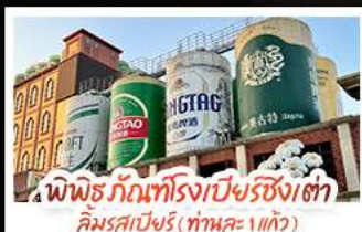
พิพิธภัณฑ์โรงเบียร์ชิงเต่า คิมรสเบียร์ (ทานคะ 1 แก้ว)