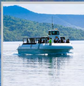
“LAKE SHIKOTSU GLASS BOAT”