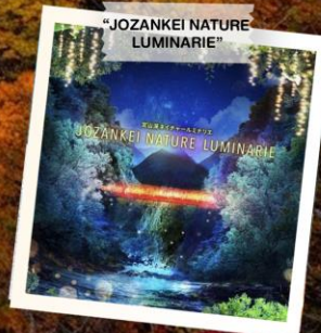
“JOZANKEI NATURE LUMINARIE”

วันเดินทาง 23 - 28 ต.ค. 2569 (วันปืยมหาราช) 28 ต.ค. - 2 พ.ย. 2569 30 ต.ค. - 4 พ.ย. 2569