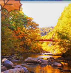
“JOZANKEI FUTAMI BRIDGE”