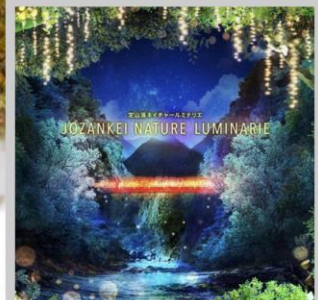
“JOZANKEI NATURE LUMINARIE”