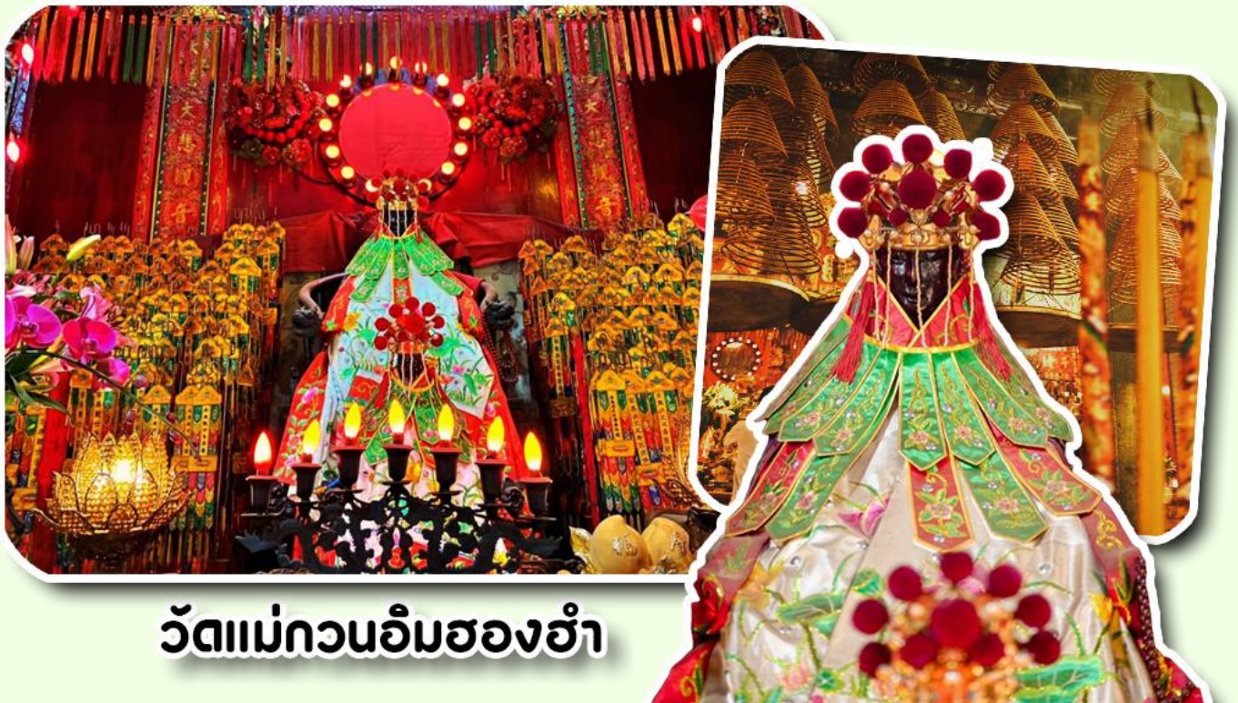
วัดแม่กวนอิมสองอ้า

จากนั้นพาท่านเข้าไปไหว้ขอพร วัดแม่กวนอิมสองอ้า วัดเก่าแก่ของฮ่องกงสร้างตั้งแต่ปี ค.ศ .1873 เป็นวัดขนาดเล็กที่มีชาวฮ่องกงศรัทธา นับถือกันเป็นอย่างมากวัดแห่งนี้เป็นที่ประดิษฐาน องค์เจ้าแม่กวนอิมสองอ้า ที่มีชื่อเสียงเรื่องการให้กู้ยืมเงินเชื่อกันว่าท่านช่วยพลิกฟื้นเศรษฐกิจของชาวฮ่องกง ผู้คนจึงนิยมมาเยี่ยมเงินทำธุรกิจจนสำเร็จ ร่ำรวย รุ่งเรืองโดยให้ท่านอธิษฐานขอพรต่อหน้า เจ้าแม่กวนอิมสองอ้าพร้อมกับระบุวันเวลาในการขอพรด้วย จากนั้นนำธูปธูปตามฐานะและศรัทธาที่ท่านจะนำเป็นสื่อในการขอพร เขียนจำนวนเงินที่ต้องการลงไปด้วย ใส่สกุลเงินยิ่งดีใหญ่ แล้วนำเงินใส่ในซองแดง ควรเตรียมซองแดงไปเอง นำซองแดงไปวนรอบกระถางธูป วนขวาจำนวน 3 ครั้ง แล้วเก็บซองแดงในกระเป๋าสตางค์ เป็นเงินขวัญถุง ถ้าประสบความสำเร็จตามที่มุ่งหวัง ให้นำเงินในซองแดงทำบุญหยอดตู้ที่วัดแห่งนี้ในโอกาสต่อไป