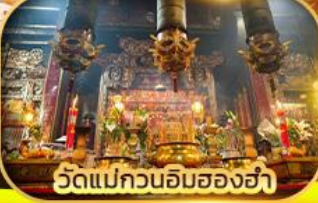
วัดแม่กวนอิมของฮ่า