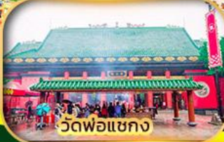
วัดพ่อแซกง