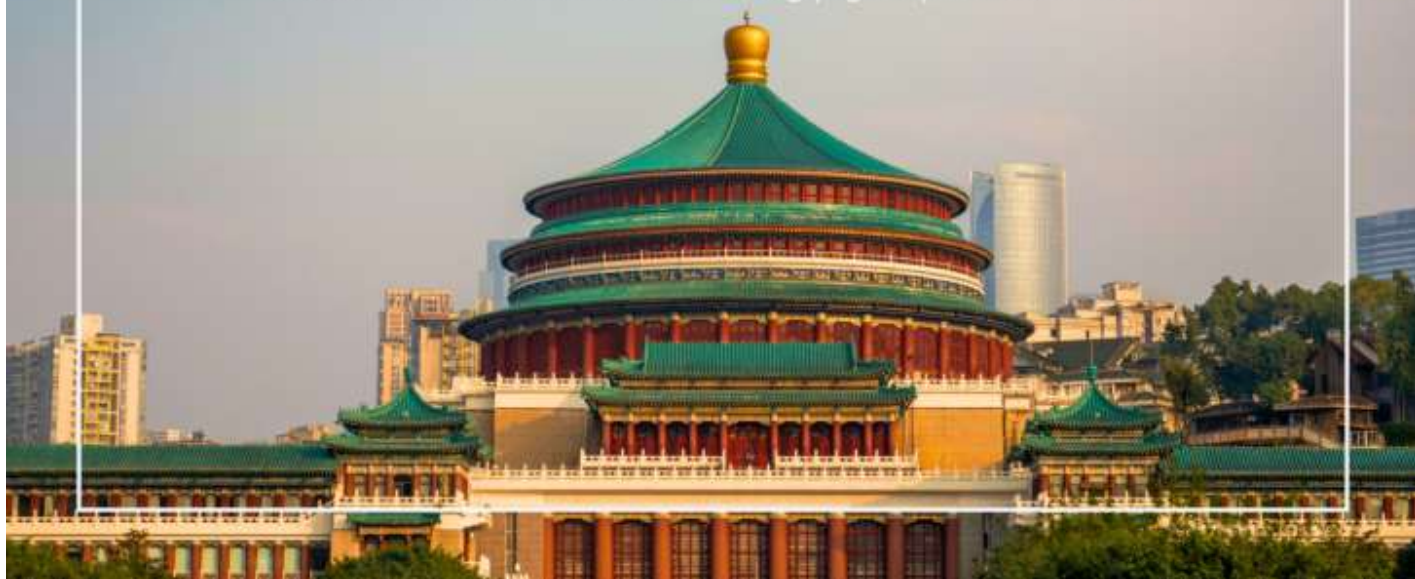
มหาศาลาประชาชนแห่งเมืองฉงชิ่ง (Chongqing People's Grand Hall)

นำท่านเที่ยวชม เมืองโบราณสีปาตี (Shibati Ancient Town) ตั้งอยู่ในเขตฉงชิ่ง (Chongqing) เป็นเมืองโบราณที่มีเสน่ห์และเต็มไปด้วยประวัติศาสตร์ อดีตของเมืองนี้ย้อนกลับไปหลายร้อยปี และมีการอนุรักษ์สถาปัตยกรรมแบบดั้งเดิมไว้เป็นอย่างดี เมืองนี้มีบ้านเรือนและอาคารที่สร้างขึ้นในสไตล์จีนโบราณ ซึ่งมีลักษณะเฉพาะที่สะท้อนถึงวัฒนธรรมและประเพณีท้องถิ่น และยังมี ถนนในเมืองโบราณสีปาตีที่มีความคดเคี้ยวและเต็มไปด้วยร้านค้า ร้านอาหาร และคาเฟ่ที่ขายสินค้าท้องถิ่น