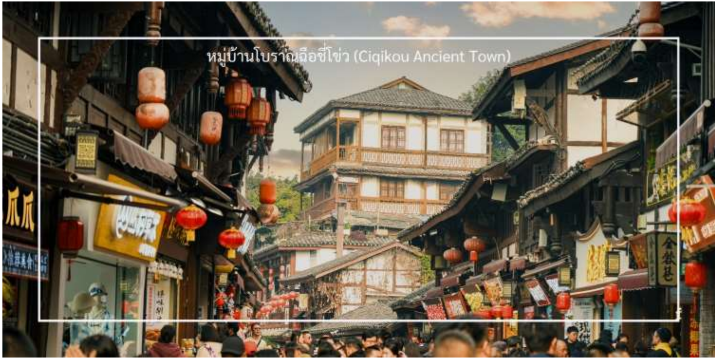
หมู่บ้านโบราณฉือชิว (Ciqikou Ancient Town)

นำท่านสู่นำท่านเดินทางสู่ คาเฟ่ Wa Ding Ding Cafe สัมผัสประสบการณ์จิบกาแฟในบรรยากาศที่ผสมผสานระหว่างโลกอนาคต และอดีต อย่างลงตัว บนชั้นดาดฟ้าตึก S95 ย่านเจียฟางเปย ไฮไลท์คือการชมวิว "วัดหลัวฮั่น"วัดเก่าแก่พันปีผานกรอบกระจกบานใหญ่ ที่ได้รับการขนานนามว่าเป็นหนึ่งในจุดถ่ายรูปที่สวยงามที่สุดของมหานครฉงชิ่ง ให้ท่านได้เก็บภาพความประทับใจของหลังคาวัดสีทองอร่ามที่ตัดกับตึกสูงระฟ้าใจกลางเมือง พร้อมดื่มด่ำกับเครื่องดื่มที่รังสรรค์มาอย่างพิถีพิถัน