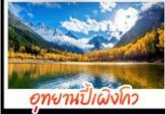
อุทยานปี้เผิงโกว