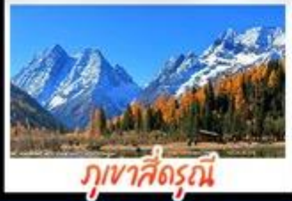
ภูเขาคีร์รูณี