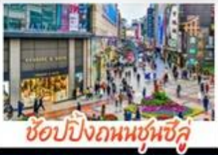
ซ้อมปิงกวมซุนซึ่ว