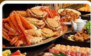
บุฟูฟัดชาบู+ยาปู 3 ชนิด