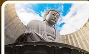
เนินเขาแห่งพระพุทธรเจ้า