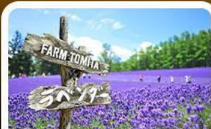
โทมิตะฟาร์ม