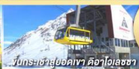
ขึ้นกระเช้าสู่ยอดเขา ดือาโกลเลซซา