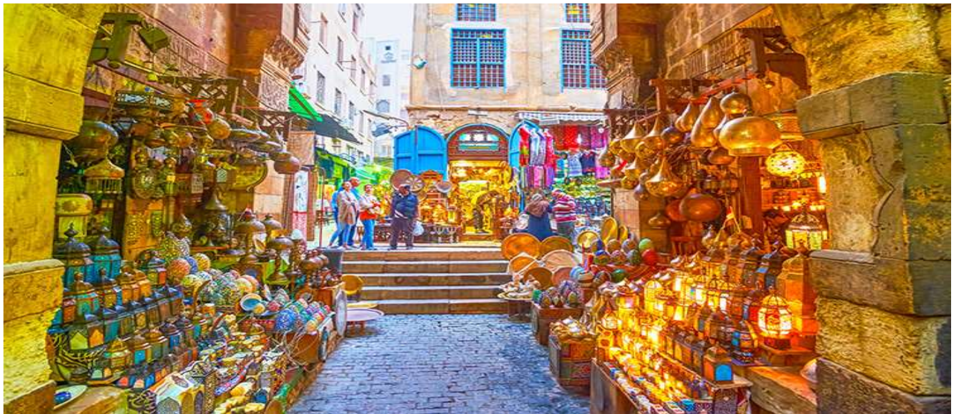
คำ บริหารอาหารเย็น ณ ภัตตาคารท้องถิ่น ถึงเวลาอันสมควรนำท่านขึ้นรถบัสปรับอากาศออกเดินทางสู่สนามบินไคโร

จากนั้นนำท่านเดินทางสู่ ตลาดข่านเอลคาลิลี (KHAN EL KHALILI) ตลาดข่าน เอล คาลิลี (KHAN EL KHALILI BAZAAR ) ประเทศอียิปต์ เป็นตลาดสไตล์อาหรับโบราณ อายุกว่า 600 ปี ถูกสร้างขึ้นครั้งแรกในช่วงปลายศตวรรษที่ 14 (ค.ศ. 1382-1389) โดย Jaharkas al-Khalili เดิมทีพื้นที่ตรงนี้เป็นสุสานของราชวงศ์ฟาติมิด ต่อมาได้มีการเคลื่อนย้ายกระดูกและสร้างอาคารพาณิชย์ขึ้น ตลาดขายของพื้นเมืองและสินค้าที่ระลึกที่ใหญ่ที่สุดในกรุง ไคโร ท่านสามารถเลือกซื้อของพื้นเมืองสวยๆ มากมาย ไม่ว่าจะเป็นขวดน้ำหอมที่ทำด้วยมือ สินค้าต่างๆ เครื่องทองรูปพรรณ และเพชรพลอย ลวดลายแบบอาหรับ พรหม และของที่ระลึกพื้นเมืองต่างๆ