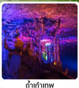
ดำเก้าทง