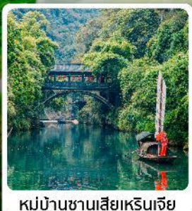
หมู่บ้านซานเสี่ยเหรินเจีย