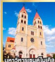
มหาวิหารเซนต์ไมเคิล