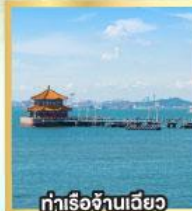
ท่าเรือจันทันเฉียว