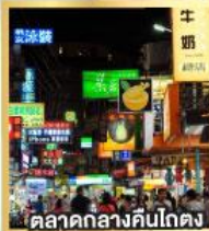
ตลาดกลางคืนโกตง