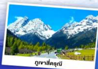
ภูเขาสีครุณี