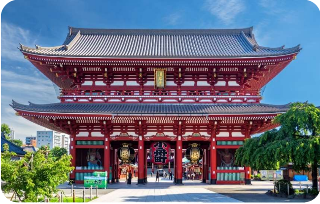
วัดอาซากุ

รับประทานอาหารเช้า ณ ห้องอาหารของโรงแรม (มื้อที่ 4)