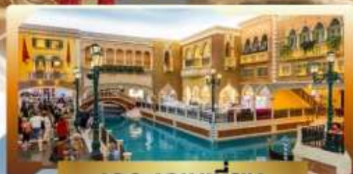
เดอะเวเนเซียน

4 วัน | 3 คืน | น้ำหนักกระเป๋า 23KG | พักโรงแรม 3 ดาว | นอนมาเก๊า 3 คืน