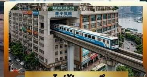
รถไฟฟ้ากะลุดัก