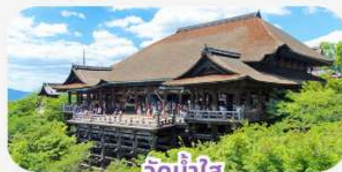
วัดน้ำใส