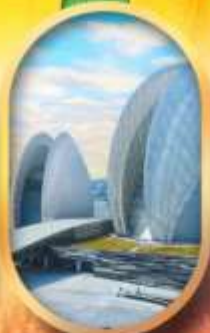
โรงละครไข่มุก