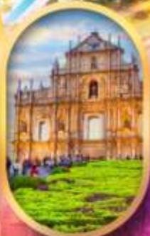
โบสถ์เซนต์พอล