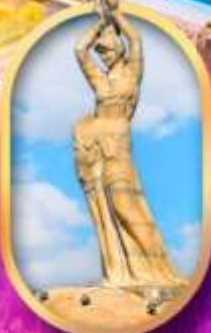
เด็กหญิงชาวประมง