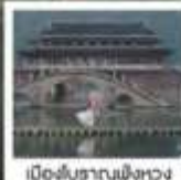
เมืองโบราณผิงหวง