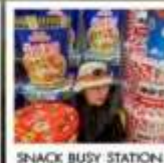
SNACK BUSY STATION