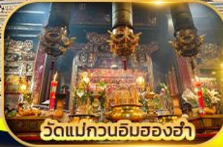
วัดแม่กวนอิมฮ่องฮ่า