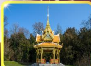
ศาลาไทยไลซานซ์