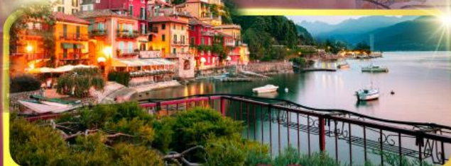
ทะเลสาบโลโบ