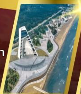
หอคอยกาลเวลา

เที่ยว 3 เมือง เต็มอิ่มจุใจ สัมผัสช่วงซากุระ สวนจงซาน เชคอินที่เที่ยวสุดคูล หอกกาลเวลา ซาจิวโซ่ว / หาดหมายเลข 3