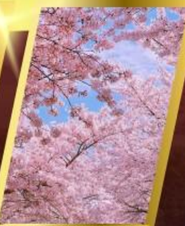
ซากุระจงซาน