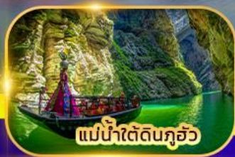
แม่น้ำใต้ดินกุ้ยชั้ว