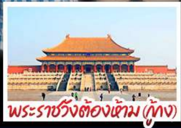
พระราชวังต้องห้าม (ปักกิ่ง)

2UPEK-CA004 | 6 วัน 4 คืน | AIR CHINA | โรงแรม 4 ดาว | ไม่ลงร้านช้อปปิ้ง