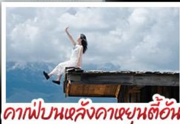
คาเฟ่บนเขาคังดาเซี่ยนต้าอัน